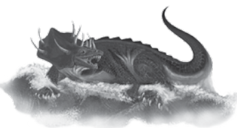
Det fjerde dyret Fryktelig og forferdelig. Romerriket