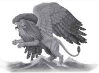
Det første dyret En løve med ørnevinger. Kaldeerriket