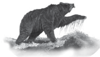
Det andre dyret En bjørn med tre ribbein i munnen. Medio-Persiske riket