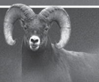
Daniel 8:3, 4, 20