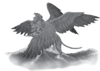
Det tredje dyret En leopard med fire vinger og fire hoder. Grekkerriket