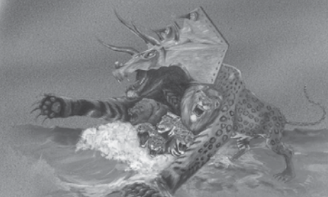
Åpenbaringen 13:1, 2